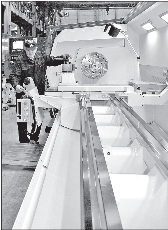
Станок обрабатывает детали до семи метров!