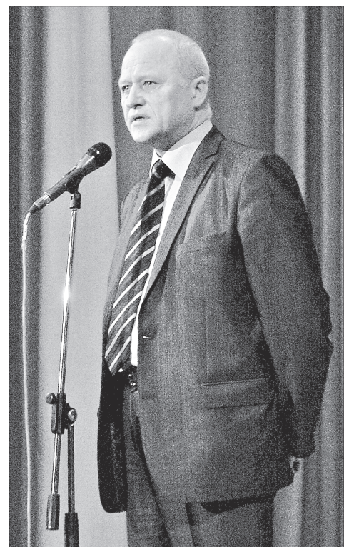
Тёплые слова уважаемым корабелам сказал генеральный директор А.А. Дьячков

Это был, без сомнения, их праздник. Праздник людей, строивших подводный флот, укреплявших своим трудом обороноспособность страны, работавших на её славу и величие. Это был праздник ветеранов Севмаша.